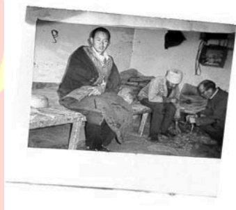
recent naar buiten gesmokkelde foto

Van uit informatie van ondermeer voormalige gevangenen, mensenrechtenorganisaties als de Laogai Research Foundation alsook van de kant van Amnesty, HRIC (Human Rights In China) en dergelijke blijkt dat er ruim 200 verschillende producten in de Laogaikampen gemaakt worden en deze zijn niet alleen voor de eigen markt bestemd maar ook ( nog steeds ) voor de... export over heel de wereld.