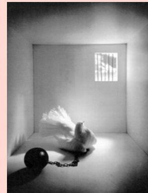
Gekooide vrijheid AMNESTY INTERNATIONAL

Vaak wordt er met dit soort acties iets bereikt, maar er zijn ook landen die er zich weinig of niets van aantrekken.